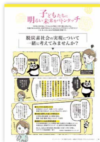
Hotpal 6月号 健康かぞくのまち 特集ページ